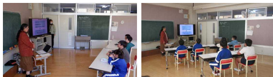
情報モラル教室の様子